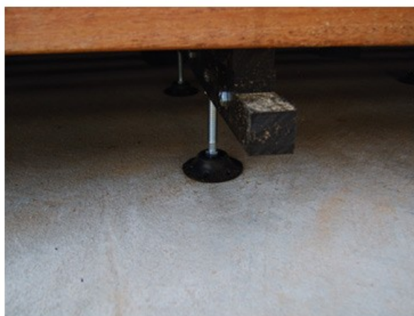
deck na stopach poziomujących

drewniane tarasy DECK-DRY ® * uzyskują ponad 100 -letnią** trwałość!, ponieważ deski od dołu - dzięki kapinosom pozostają w stanie powietrzno-suchym, (w którym nie rozwijają się grzyby klas : Zygo-, Asco-, Basidio-, oraz Deutero-, mycetes), od góry - drewno (nieuszkodzone wkrętami) łatwo konserwuje się olejem (z frakcjami antygrzybicznymi) - dlatego uzyskują one większą trwałość od terakoty (w innych systemach wilgoć zalega w stykach desek z legarami, łącznikami gdzie zniszczy każdy gat drewna)