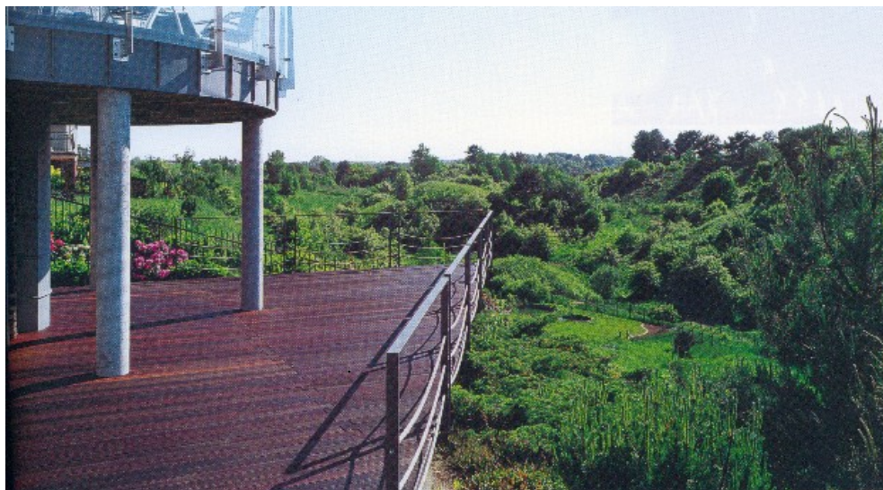
deck po konserwacji

deska bangkirai 1,8 x 9,0 cm , ryfel drobny / polietylenowe podkładki 1,3 cm + polietylen. legary montażowe deck-u 3,0 cm / deck z 1,5% spadkiem / podłoże - konstrukcja stalowa